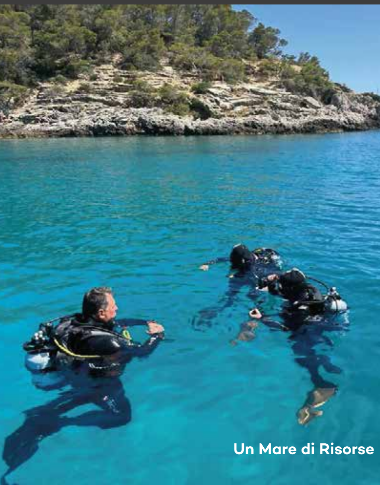
Un Mare di Risorse